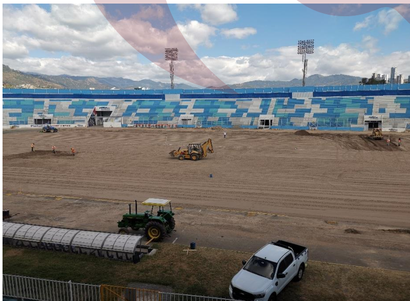
Fotografía 4: El contratista contaba con la maquinaria y el personal necesario para la ejecución del proyecto dándole cumplimiento al contrato; como se puede constatar en la imagen tenía a su disposición. Retroexcavadoras y Tractores

En relación a la verificación sobre el cumplimiento del contrato de construcción por parte de la empresa contratista Sistema de Construcción S. de R.L. en la cláusula 15 establece que “ el personal de EL CONTRATISTA será aprobado, por escrito, por EL CONTRATANTE a través de la Supervisión y la CONDEPOR. Todo el personal técnico deberá estar inscrito en su respectivo colegio profesional y acreditar su solvencia con el mismo ”; no se ha encontrado evidencia de la aprobación por parte del Supervisor del Proyecto por parte de CONDEPOR.