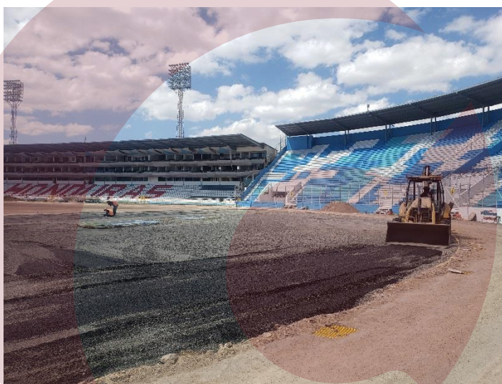
Fotografía 3: Maquinaria colocando Grava en medias lunas de campo de juego.