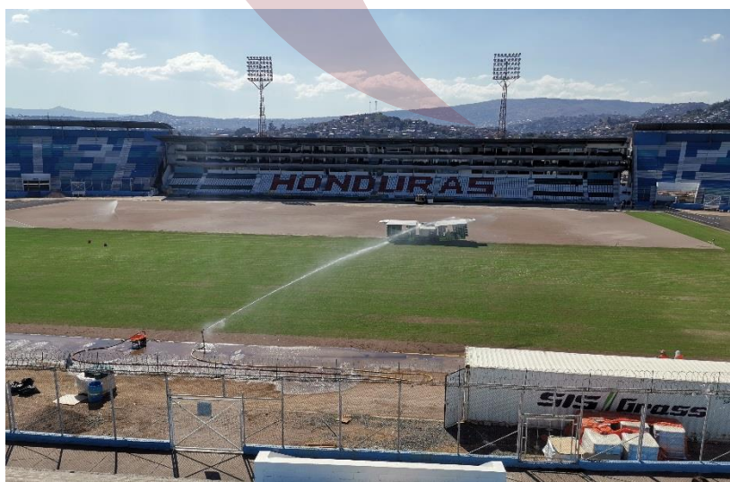
Fotografía 1: Vista del proceso cosido de engramillado sintético en el Estadio Nacional José de la Paz Herrera “Chelato Uclés”

La supervisión de este proyecto es ejecutada por personal de la institución, siendo asignada a la Gerencia de Proyectos de Infraestructura y Mantenimiento de las Instalaciones de la Comisión Nacional de Deportes, Educación Física y Recreación (CONDEPOR). (ver anexo #4)