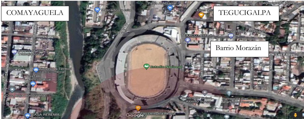
Imagen #1: Ubicación del Estadio Nacional José de la Paz Herrera “Chelato Uclés”.

El Estadio Nacional José de la Paz Herrera Uclés , o simplemente Estadio Chelato Uclés (anteriormente denominado Estadio Nacional Tiburcio Carías Andino ), es uno de los escenarios deportivos más importantes de Honduras, está ubicado en el Barrio Morazán de la ciudad de Tegucigalpa, en el Distrito Central.