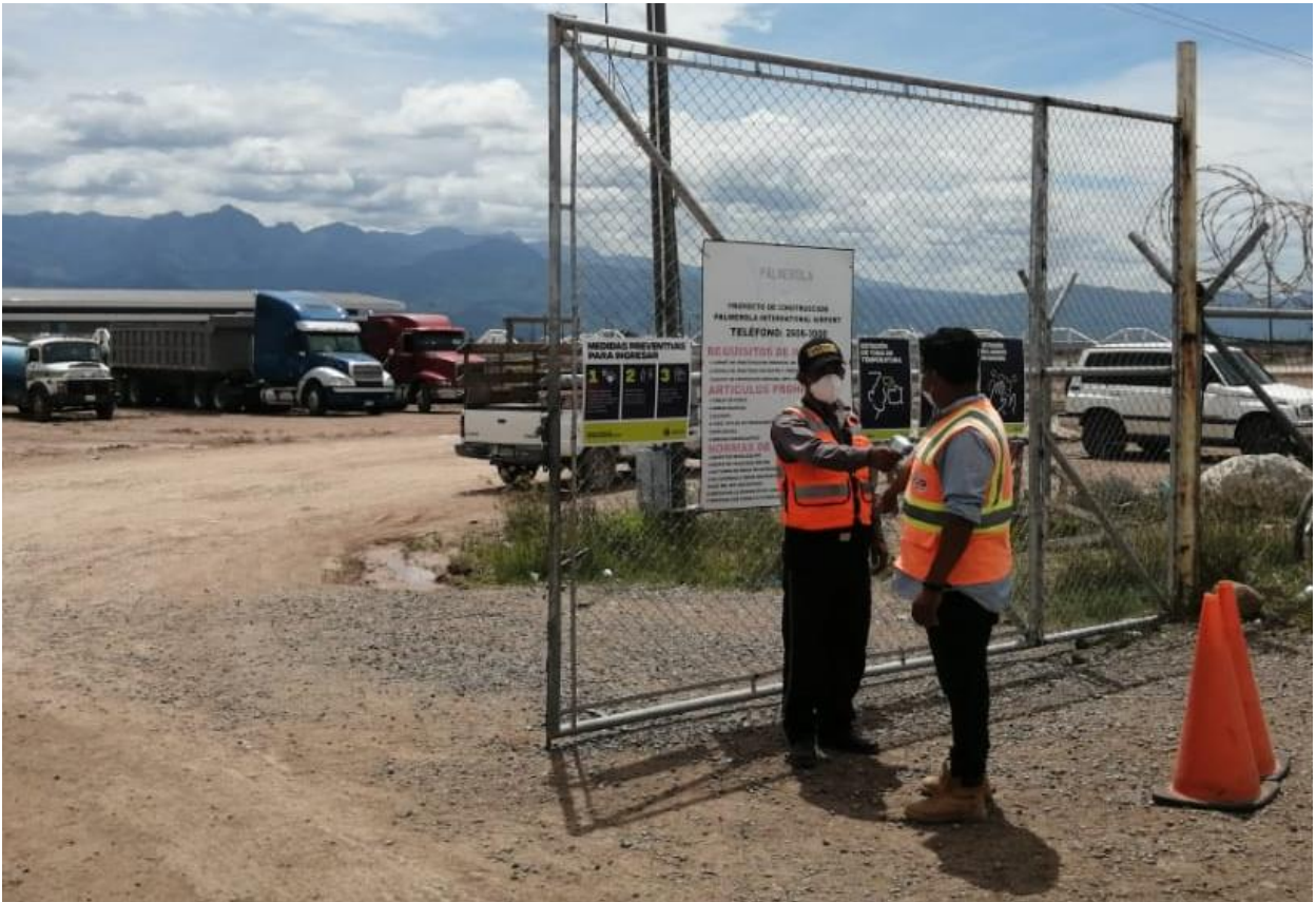
Control de medidas de bioseguridad en la estación de ingreso de empleados y visitantes autorizados