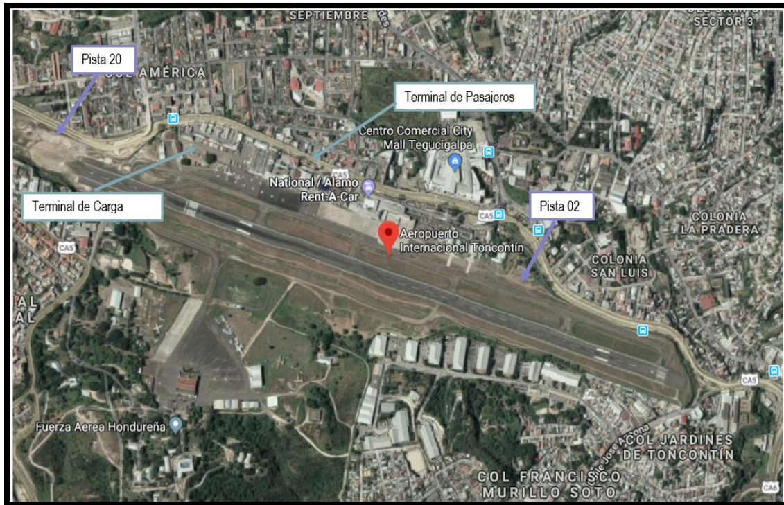
Mapa de Ubicación

Este aeropuerto proporciona servicios de pasajeros y carga para operaciones comerciales, privados y militares, para rutas domésticas e internacionales.