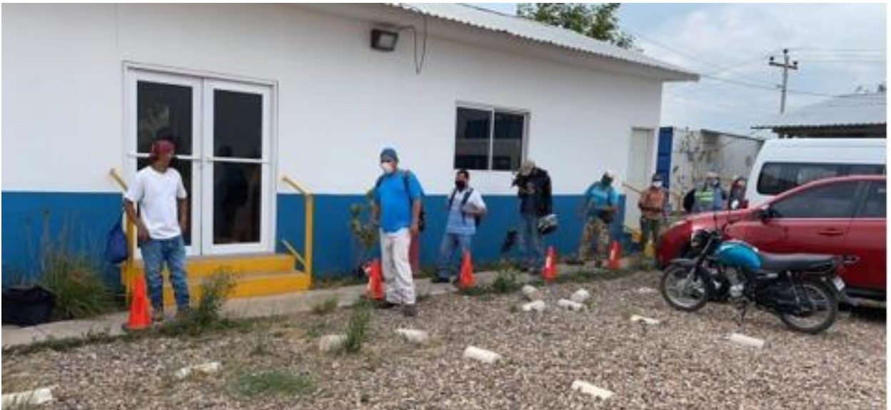
Personal haciendo fila para entrar a realizarse pruebas de laboratorio COVID-19