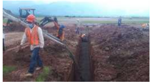
Obra #2 Calle de rodaje para conectar plataforma con el resto del campo de vuelo