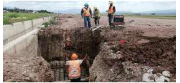
Trabajando en la Plataforma de estacionamiento de aeronaves