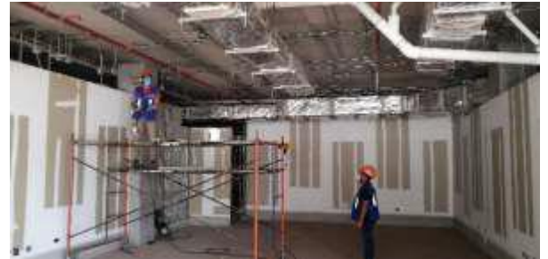
Obras en el Estacionamiento Vehicular