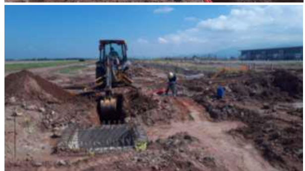
Obras de interfase con el PCD, Anillo de Media Tensión No 3