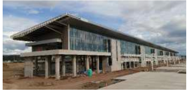
Vista general de la Terminal del Aeropuerto