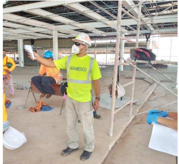
Tomas de temperatura se realizan con frecuencia durante la jornada de trabajo