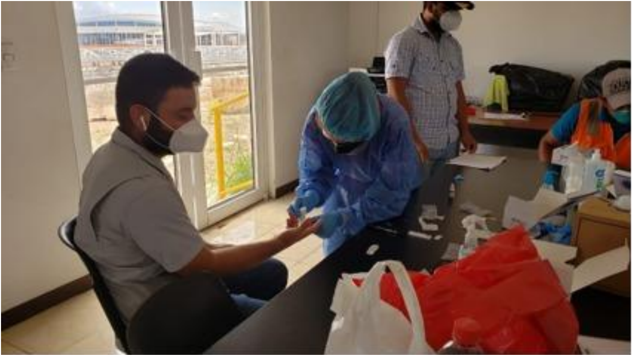
Toma de muestra para prueba de laboratorio una vez por semana